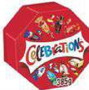
CELEBRATIONS CENTERPIECE g 385