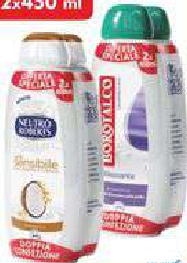
BAGNODOCCIA BOROTALCO/ NEUTRO ROBERTS disinfettante ml 450x2