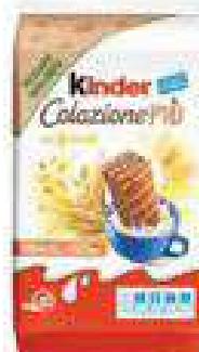
COLAZIONE PIÙ KINDER g 290