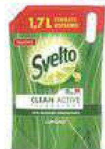
DETERSIVO PIATTI SVELTO Bibite: ml 1700