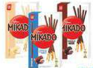
MIKADO cioccolato g 70