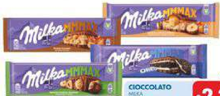
CIOCOLATO MILKA pasta nocciola g 270/300