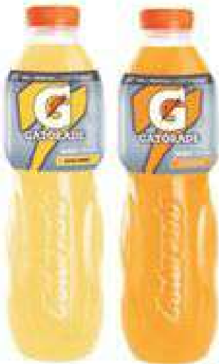
GATORADE Bibita sportiva L1