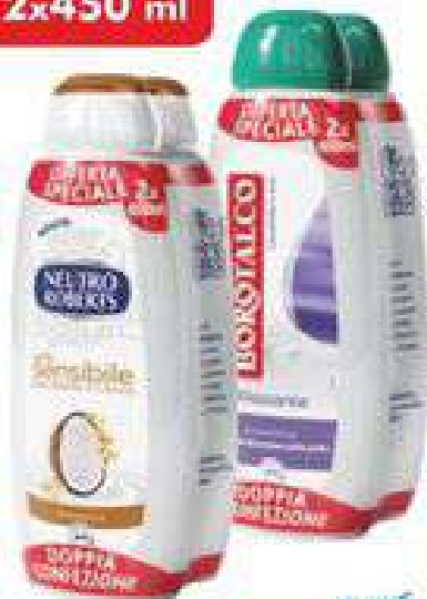
BAGNODOCCIA BOROTALCO/ NEUTRO ROBERTS disinfettante ml 450x2