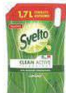
DETERSIVO PIATTI SVELTO Bibite: ml 1700